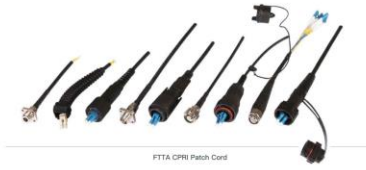
FTTH CPRI Patch Cord